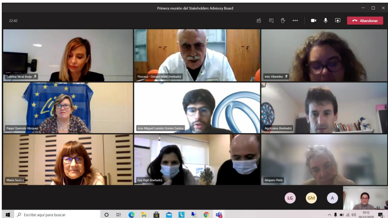
Figure 6. Screenshot of some of the attendants to the cross-sectorial dynamic.

In the dynamic the main problems that egg processing companies have to face nowadays were identified: